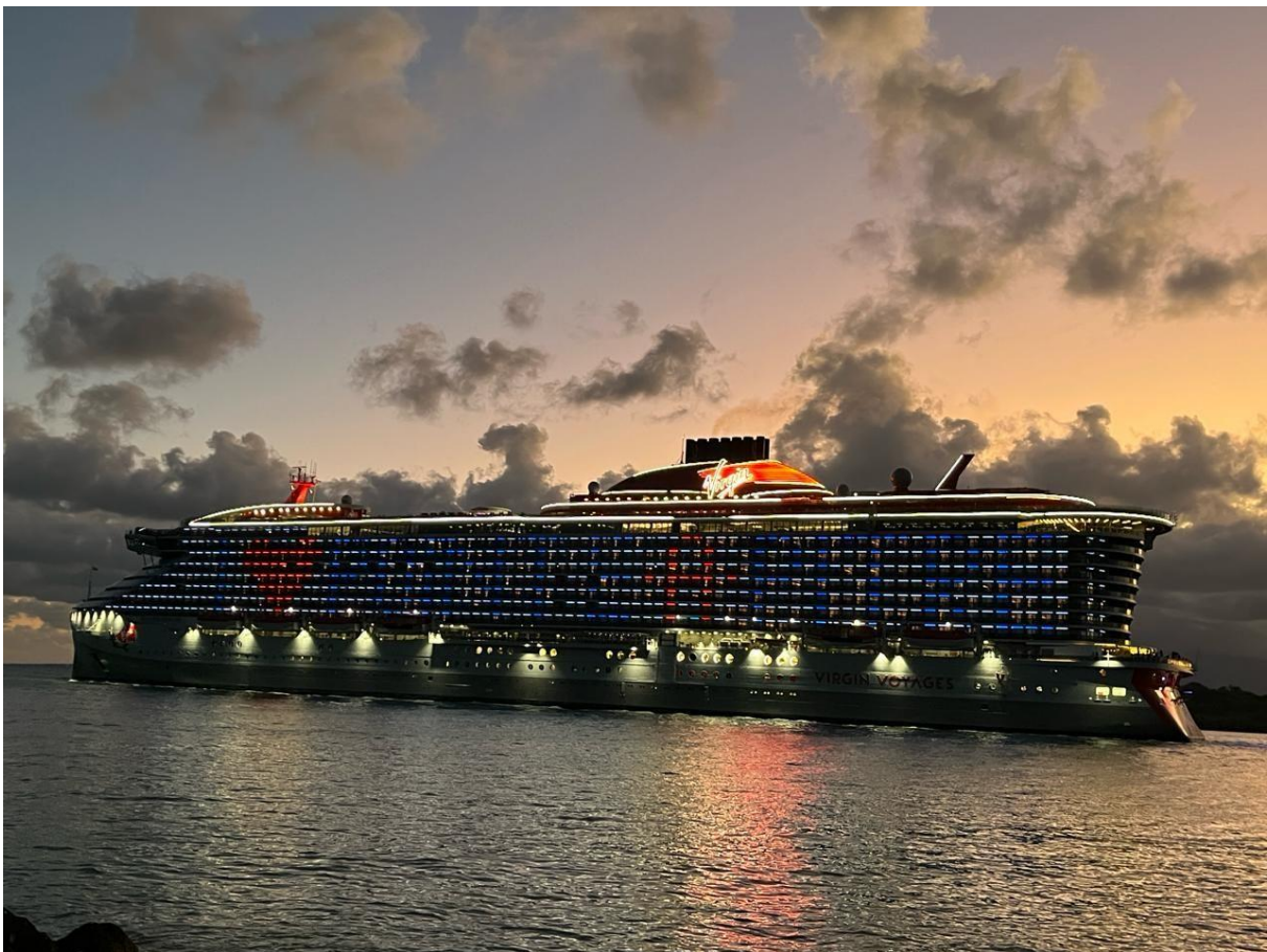
Variant Lady

De fait, cette dernière proposition a été validée par la compagnie. Les 12 escales initialement programmées pour la prochaine saison 2024-2025 ont été tout simplement annulées.