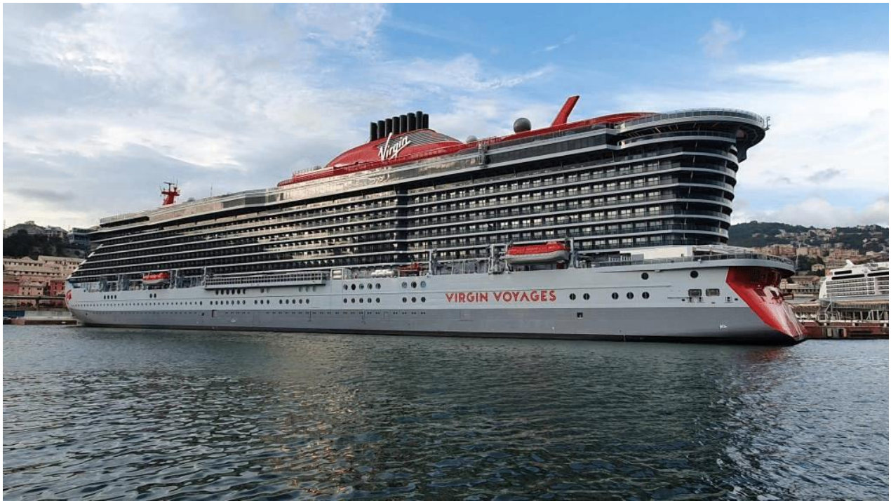
Le "Valiant Lady"

Reste à comprendre maintenant les raisons qui font de l'escale guadeloupéenne la lanterne rouge de ce classement.