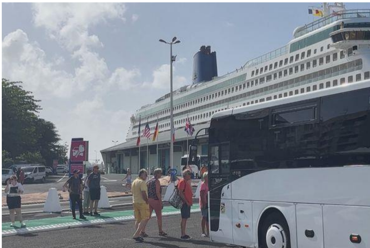
Arrivée des croisiéristes au Terminal de Pointe-à-Pître

Virgin Voyages ne viendra plus en Guadeloupe. Après six escales à Pointe-à-Pître qu'elle considère comme catastrophiques, la compagnie de croisière annule les 12 escales programmées pour la saison 2024-2025. Ses clients étaient très insatisfaits de l'escale guadeloupéenne.